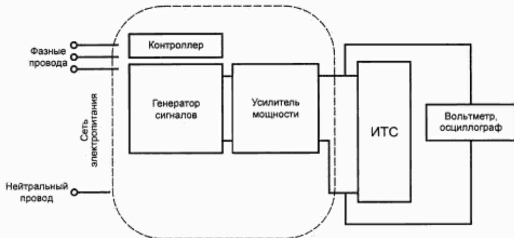
Рисунок 3 — Схема испытательного оборудования с усилителем мощности